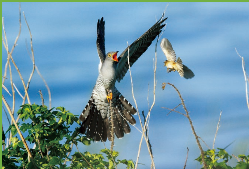
▲第23回写真コンテスト動物部門 1席「バトル・托卵」(岩淵 民子さん)