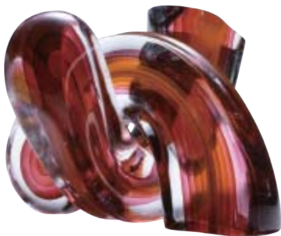
ハーヴェイ K. リトルトン 《向かい合う放物線の形》 1981年

いレベルで実現したチェコのリベンスキー。日本の伝統的な美意識を感じさせる「 かざりばこ 飾篭」シリーズで国際的に高い評価を受けた藤田喬平。米国・欧州・日本それぞれの創作を牽引した作家を中心に地域的な特性に焦点を当てながら、個性豊かな作品をご紹介します。