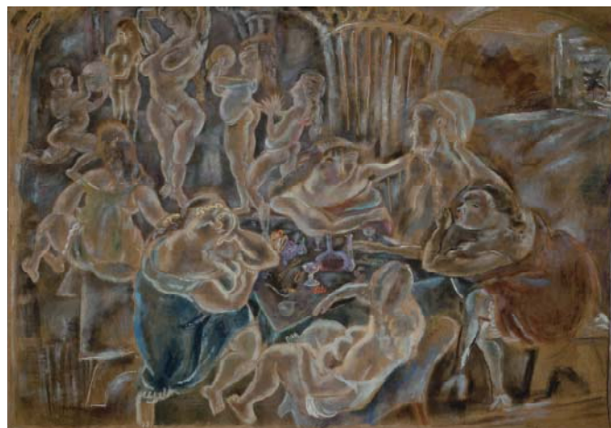
ジュール・パスキン〈放蕩息子〉1922年

ロシアのヴィテブスクにユダヤ人として生まれたマルク・シャガール(1887～1985)は、1910年パリに生まれました。故郷への想いや民族愛に根ざしたモチーフ、旧約聖書やギリシア神話の主題、そして寄り添う恋人たちの姿を繰り返し描きましたが、とりわけ晩年の作品には、二度にわたる大戦を生き抜いた、ユダヤ人としての精神世界が反映されるようになります。ジュール・パスキン(1885～1930)もまたユダヤ人として、ブルガリアのヴ